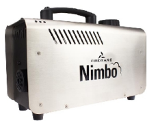
001-012-001 FireWare Nimbo Nebelmaschine