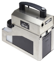
003-012-001 FireWare Cirrus Akku-nebelmaschine