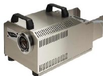
002-012-001 FireWare Cumulus Nebelmaschine