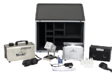
040-030-032 Ausbildung Set Brandherd V4 - NL