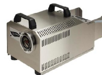
002-012-002 FireWare Stratus Nebelmaschine