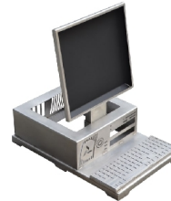
049-012-042 Add-on Computer