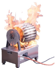
049-012-005 Add-on Electric Motor