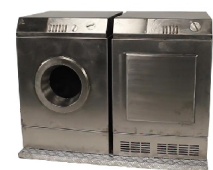
049-012-017 Add-on Wash Dry Combination