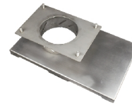
049-012-019 Add-on Adapter Vesta > Haagen