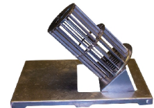
049-012-038 Add-on Explosion Cage