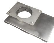
049-012-019 Add-on Adapter Vesta > Haagen