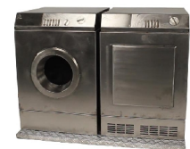
049-012-017 Add-on Wash Dry Combination