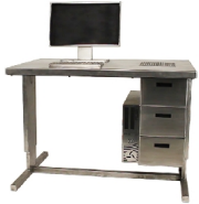
049-012-018 Add-on Desk with Computer