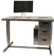
049-012-018 Add-on Desk with Computer