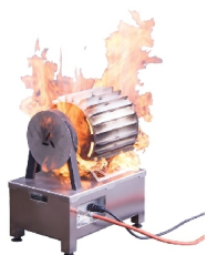
049-012-005 Add-on Electric Motor