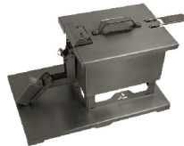
049-012-031 Add-on Fryer