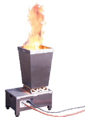
049-012-006 Add-on Garbage Bin