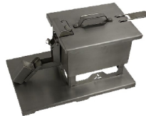
049-012-031 Add-on Fryer