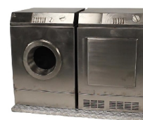
049-012-017 Add-on Wash Dry Combination