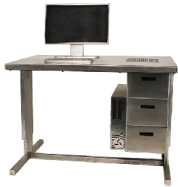
049-012-018 Add-on Desk with Computer