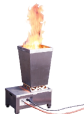
049-012-006 Add-on Garbage Bin