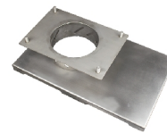
049-012-019 Add-on Adapter Vesta > Haagen