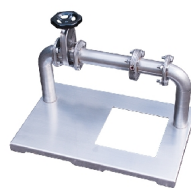
049-012-002 Add-on Flange Fire