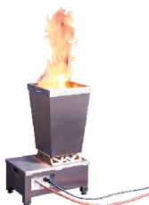
049-012-006 Add-on Garbage Bin