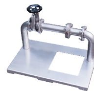
049-012-002 Add-on Flange Fire