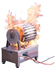
049-012-005 Add-on Electric Motor