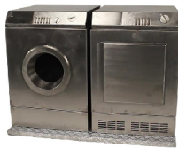
049-012-017 Add-on Wash Dry Combination