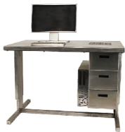
049-012-018 Add-on Desk with Computer