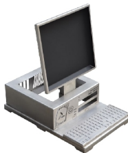
049-012-042 Add-on Computer