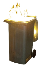
049-012-008 Add-on Wheeled Bin