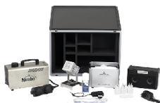
040-030-032 Set d'Entraînement Foyer d'Incendie V4 - NL