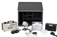
040-030-032 Set d'Entraînement Foyer d'Incendie V4 - NL