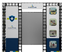
010-012-001 FireWare Interactive Incident Trainer (F.I.T.T.)