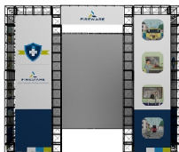
010-012-001 FireWare Interactive Incident Trainer (F.I.T.T.)