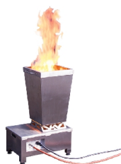
049-012-001 FireWare Vesta