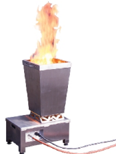
049-012-006 Add-on Garbage Bin