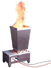
049-012-001 FireWare Vesta