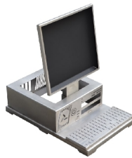
049-012-042 Add-on Computer