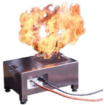
049-012-001 FireWare Vesta