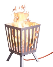
049-092-012 Solid Firetrainer