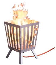
049-092-012 Solid Firetrainer