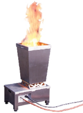
049-012-001 FireWare Vesta