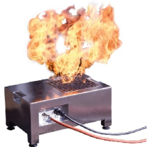
049-012-001 FireWare Vesta