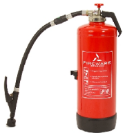
025-100-100 FireWare Neptune Extincteur d'exercice bouton de réglage 6 L