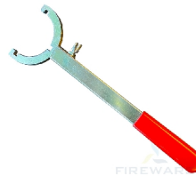
061-100-003 Clé Plate pour l'Extincteur d'Exercice