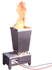
049-012-006 Add-on Garbage Bin