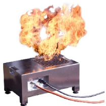
049-012-001 FireWare Vesta