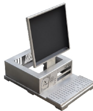
049-012-042 Add-on Computer