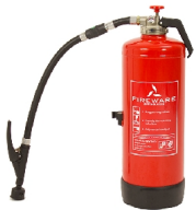
025-100-100 FireWare Neptune Extincteur d'exercice bouton de réglage 6 L