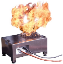
049-012-001 FireWare Vesta