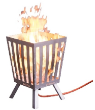
049-092-012 Solid Firetrainer