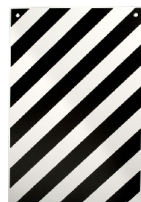
027-028-010 Panneau Traditionnel Indicateur de Barrage