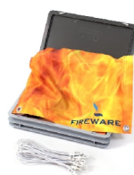
027-028-005 Toile à effet flamme