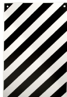
027-028-010 Panneau Traditionnel Indicateur de Barrage