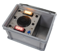
025-012-051 FireWare Pandora's Box V4