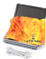
027-028-005 Toile à effet flamme