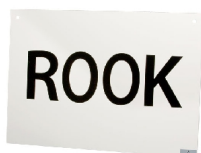
027-028-012 Traditional "Rook" Sign