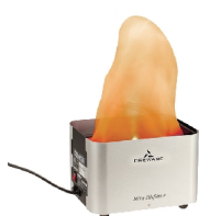
011-012-008 FireWare Mini-Silkflame LED