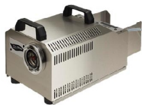
002-012-001 FireWare Cumulus machine de fumée