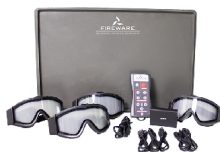
025-021-013 FireWare Nebula RA masque aveuglant Maxi-set