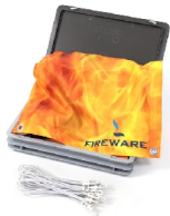
027-028-005 Toile à effet flamme