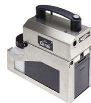
003-012-001 FireWare Cirrus machine de fumée sur batterie