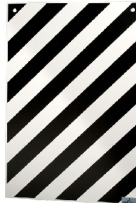
027-028-010 Panneau Traditionnel Indicateur de Barrage