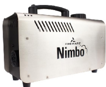
001-012-001 FireWare Nimbo machine de fumée