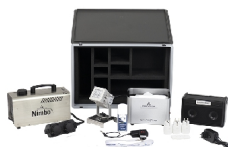
040-030-032 Set d'Entraînement Foyer d'Incendie V4 - NL