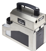
003-012-001 FireWare Cirrus machine de fumée sur batterie