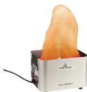
011-012-008 FireWare Mini-Silkflame LED