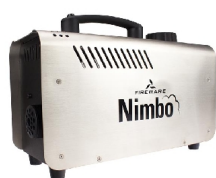
001-012-001 FireWare Nimbo machine de fumée