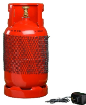
025-027-003 Bouteille de Gaz d'Exercice Rouge