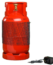
025-027-003 Bouteille de Gaz d'Exercice Rouge