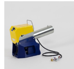
025-026-020 Electronic Explosion Simulator Télécommande inclusive