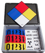
028-030-009 Feu Diamant (NFPA) le kit magnétique