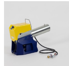
025-026-020 Electronic Explosion Simulator Télécommande inclusive