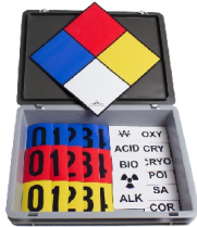
028-030-009 Feu Diamant (NFPA) le kit magnétique