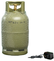
025-027-004 Bouteille de Gaz d'Exercice Vert