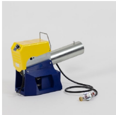
025-026-020 Electronic Explosion Simulator Télécommande inclusive