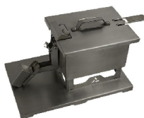
049-012-031 Add-on Fryer