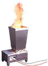
049-012-006 Add-on Garbage Bin