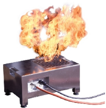
049-012-001 FireWare Vesta