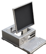
049-012-042 Add-on Computer