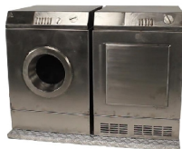
049-012-017 Add-on Wash Dry Combination