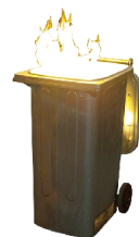
049-012-008 Add-on Wheeled Bin