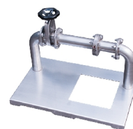
049-012-002 Add-on Flange Fire