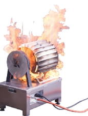
049-012-005 Add-on Electric Motor