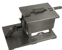
049-012-031 Add-on Fryer