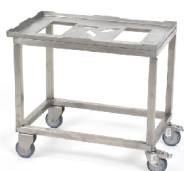
049-012-001 FireWare Vesta