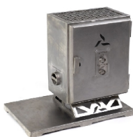
049-012-048 Add-on Coffret électrique