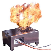
049-012-001 FireWare Vesta