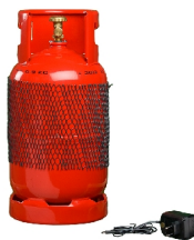
025-027-003 Bouteille de Gaz d'Exercice Rouge