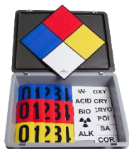
028-030-009 Feu Diamant (NFPA) le kit magnétique