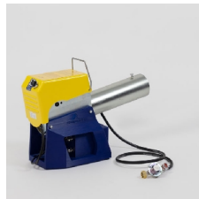
025-026-020 Electronic Explosion Simulator Télécommande inclusive