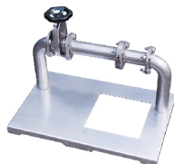
049-012-002 Add-on Flange Fire