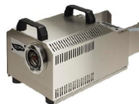
002-012-001 FireWare Cumulus machine de fumée