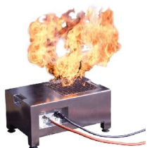
049-012-001 FireWare Vesta