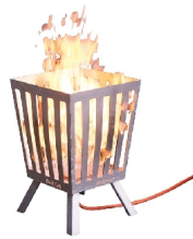
049-092-012 Solid Firetrainer