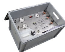
025-012-007 FireWare Neptune système de remplissage