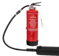
025-100-099 FireWare Neptune Extincteur d'exercice poignée à presser 6 L