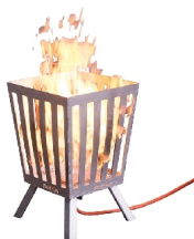
049-092-012 Solid Firetrainer