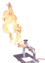
049-012-013 Stand-alone Flange Fire