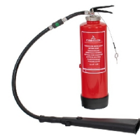
025-100-095 FireWare Neptune Extincteur d'exercice poignée à presser 6 L