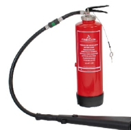
025-100-095 FireWare Neptune Extincteur d'exercice poignée à presser 6 L