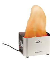
011-012-008 *FireWare Mini-Silkflame LED*