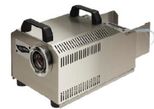
002-012-002 *FireWare Stratus rookmachine*