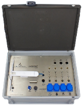
012-012-002 FireWare Incident Trainer Client