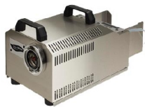
002-012-001 *FireWare Cumulus rookmachine*