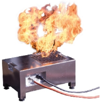
049-012-001 *FireWare Vesta blustrainer*