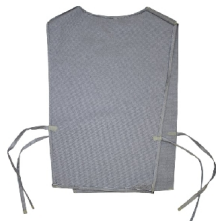
017-062-006 Hesje voor Brandpop Zilver - los onderdeel