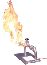
049-012-013 Stand-alone Flange Fire