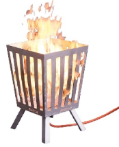
049-092-012 Solid Fire Blustrainer