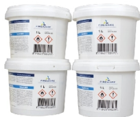
029-030-002 Brandgel Rookarm 4x 1 L