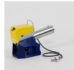
025-026-020 Explosie Simulator V2