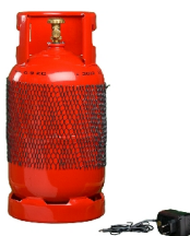
025-027-003 Sissende Oefengasfles Rood