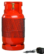
025-027-003 Sissende Oefengasfles Rood