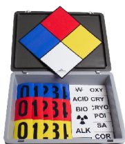
028-030-009 FireWare Magnetische Gevarendiamant set