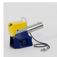
025-026-020 Explosie Simulator V2