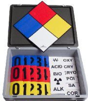
028-030-009 FireWare Magnetische Gevarendiamant set